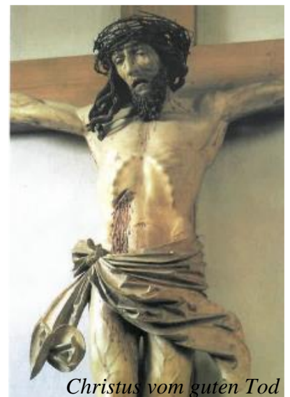
Christus vom guten Tod in der Pfarrkirche in Brixen